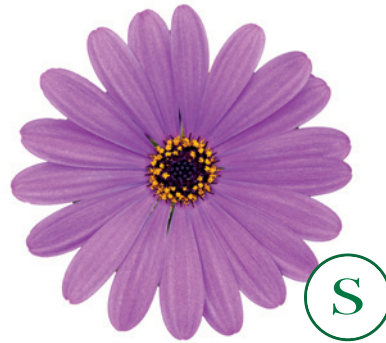
035523 LAVENDER BLUE