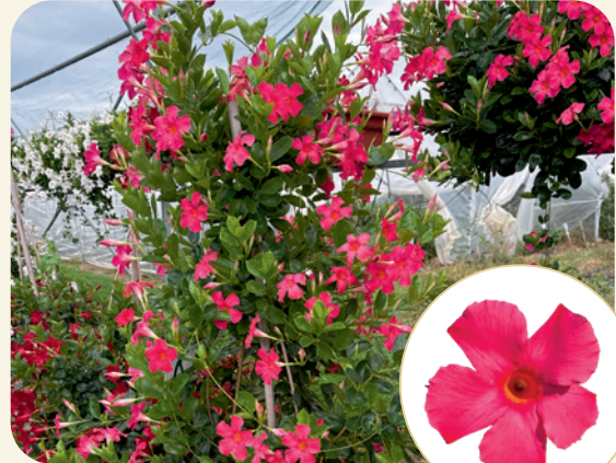
995018 EARLY PINK

Precocitate și comportament similar cu Early Scarlet