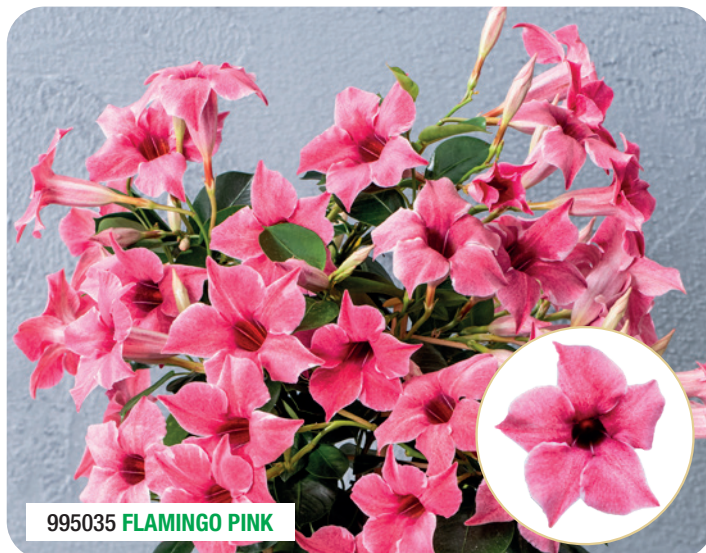
995035 FLAMINGO PINK

Intensitatea culorii variază în funcție de luminozitate și temperatură Precocitate și comportament similare cu gama Classic