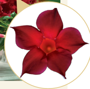
995008 DARK RED

Adatta a tutti gli usi, medio-precoce, coltivazione in vasi 12-14, anche senza sostegno