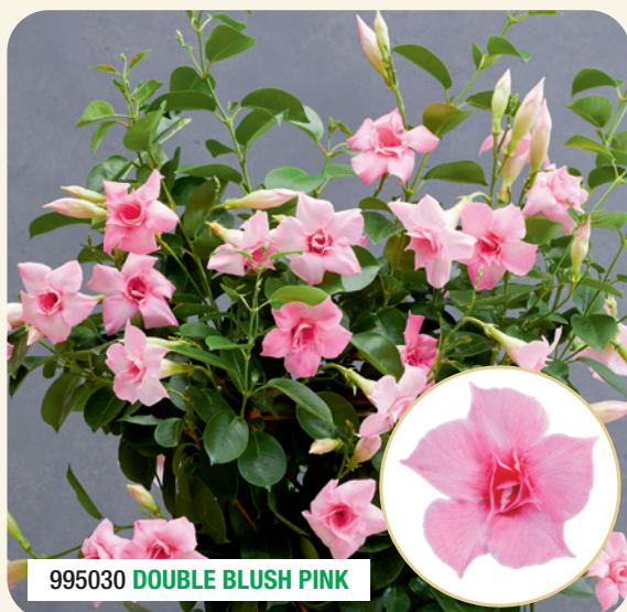
995030 DOUBLE BLUSH PINK