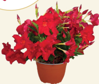
995220 BRILLIANT RED

Roșu intens, strălucitor Creștere medie, port erect