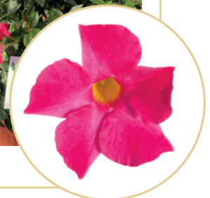
995225 SHOCK PINK