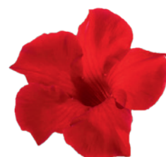
995063 CARMINE RED