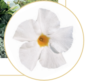
995216 WHITE DARK LEAF