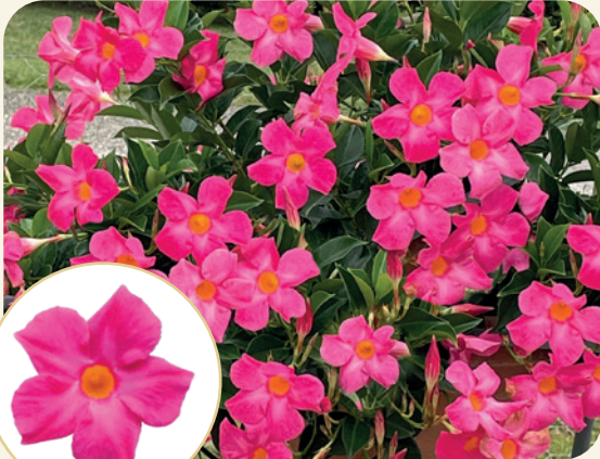
995027 FASHION PINK

Timpuriu și extrem de rezistent in plin soare