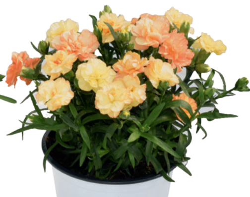
037783 YELLOW SUNSET