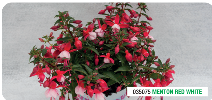
035075 MENTON RED WHITE