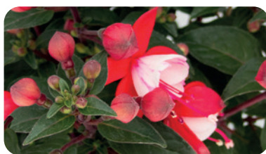
035078 NARBONNE RED WHITE