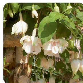
035006 PINK MARSHMALLOW