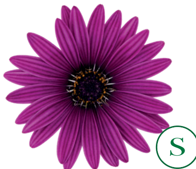
035528 ZANZIBAR ANTIQUE PURPLE