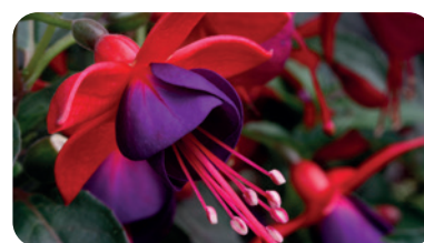
035076 NANTES RED BLUE