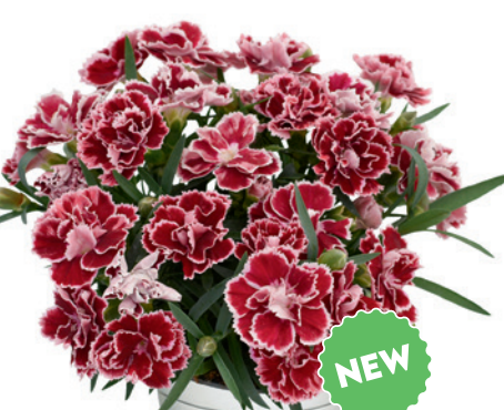
037758 CHERRY PICOTEE EXP