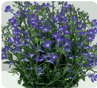
035105 DARK BLUE