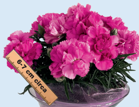
037750 PRINCESS KATE

Einzigartige spezielle Sorte, die es zu nutzen gilt! Sehr duftend - Große & frühe Blüten