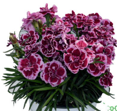
037755 MAGENTA PICOTEE