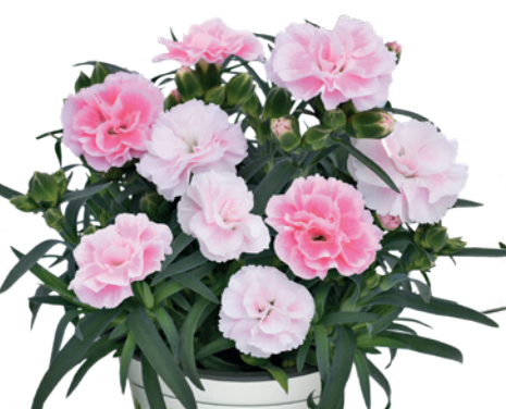
037785 PASTEL PINK