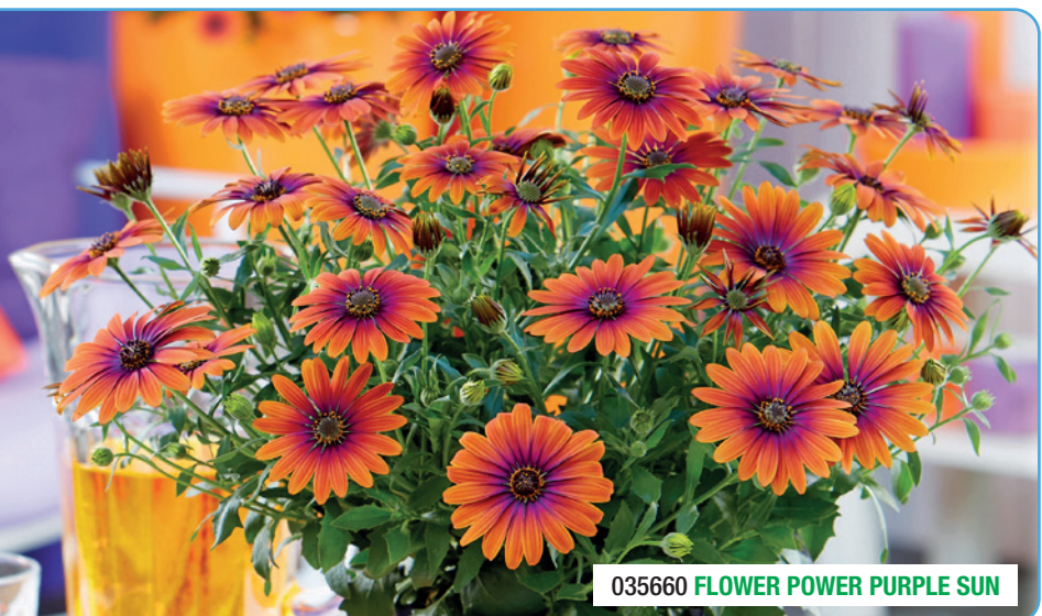
035660 FLOWER POWER PURPLE SUN