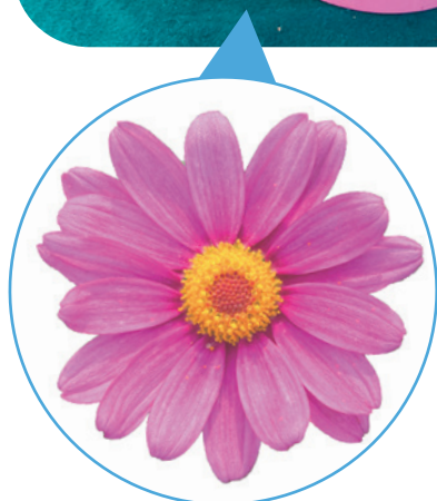
036042 FASHION PINK

Starkwüchsige Serie für 14 - 20 cm Töpfe Eignet sich für den langen sowie für den kurzen Zyklus Runde Krone ohne Vergilbung