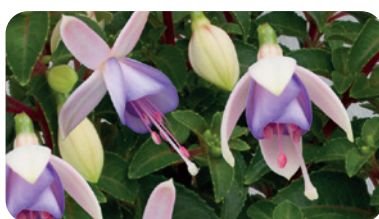
035074 MACON WHITE BLUE