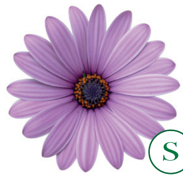
035521 ZANZIBAR ANTIQUE ROSE