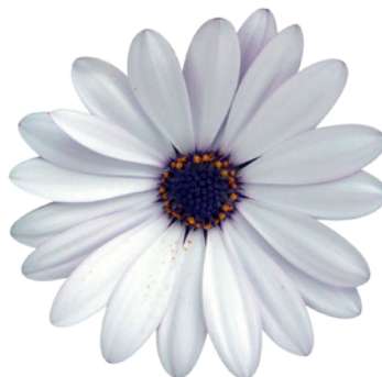
035520 ZANZIBAR WHITE