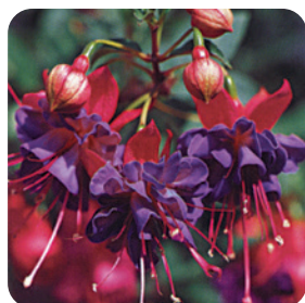
035056 WINSTON CHURCHILL