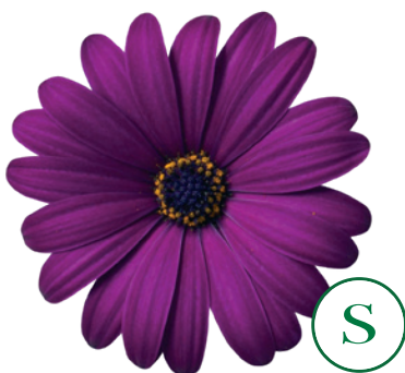
035522 MASERU PURPLE