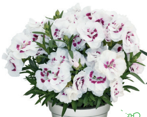
037784 WHITE W.EYE EXP