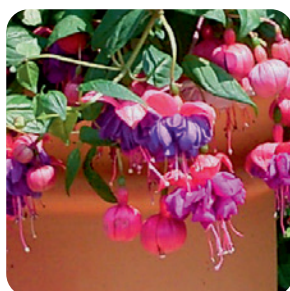
035001 BLUE EYES