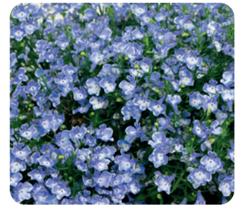
035107 CALA BLUE