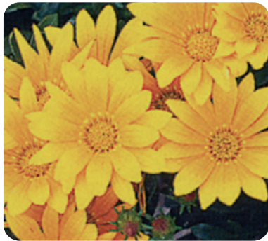
035703 GELBE JUPITER