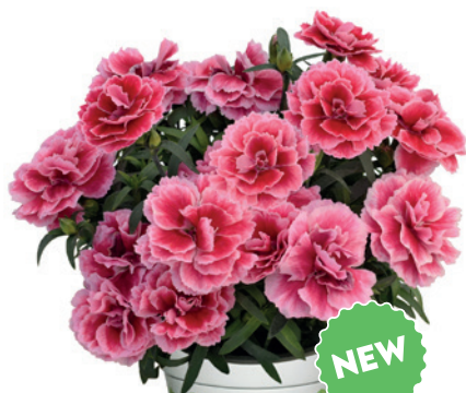
037787 MAGIC PINK