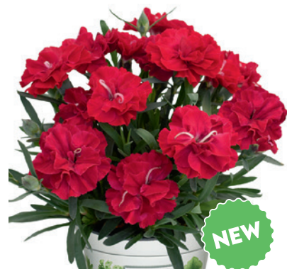
037765 CARMINE RED EXP