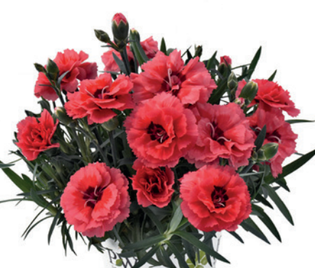
037786 DARK SALMON