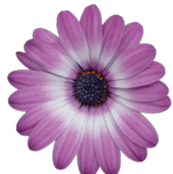
035525 ZANZIBAR ROSE BICOLOUR