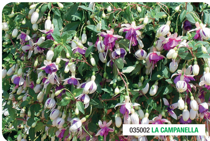
035002 LA CAMPANELLA

Starkwüchsig und hängend Ideal für Ampeln Geeignet für Kaltkultur