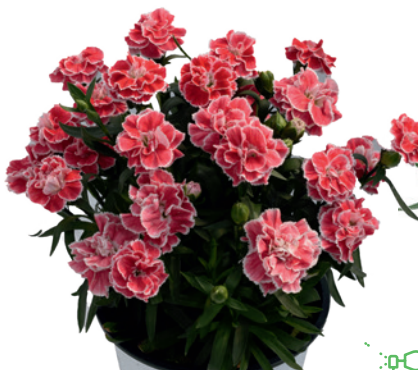
037757 RED PICOTEE