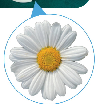
036030 CHICCO WHITE