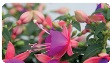
035077 NANCY ROSE LILAC