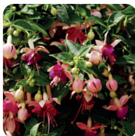
035080 PAULA JANE