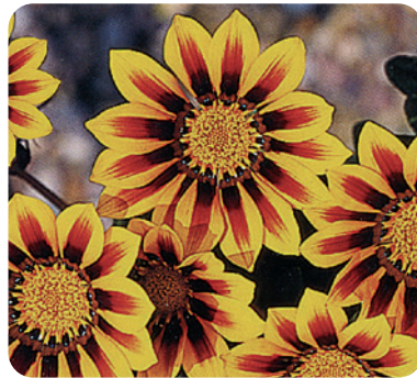
035705 MAGIC YELLOW