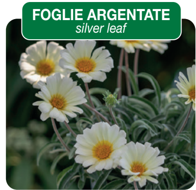
035710 SUN LOVE