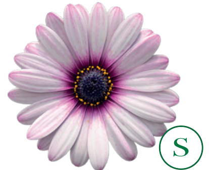
035533 EYECATCHER PINK