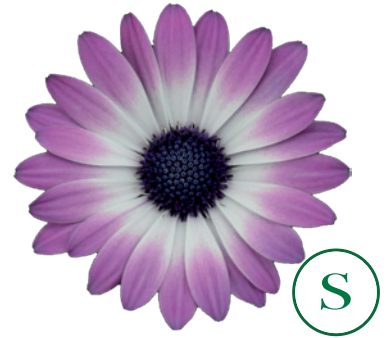
035526 PINK BICOLOUR