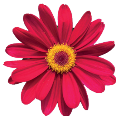
036043 PENNY RED