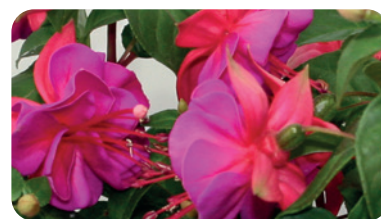
035079 MIRAVAL ROSE LILAC