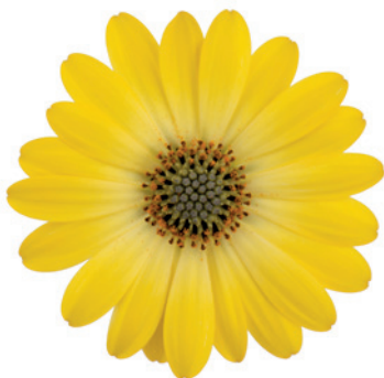
035515 ZANZIBAR SUNLIGHT