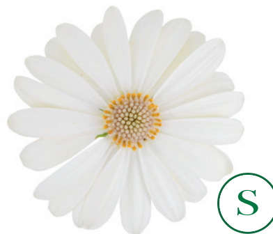
035532 IVORY IMP