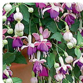
035005 PINK BALLET GIRL