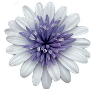
035648 SILVER BLUE