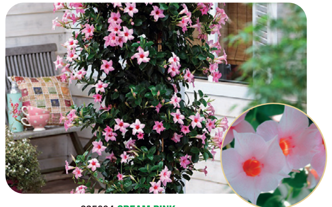
995004 CREAM PINK