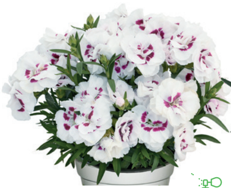
037784 WHITE W.EYE EXP