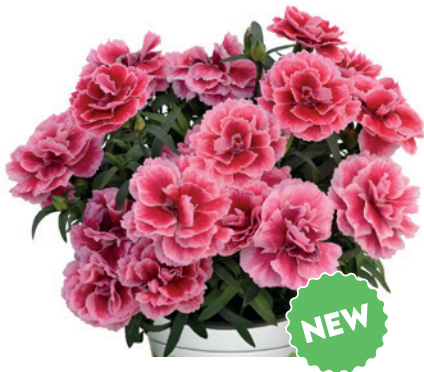
037787 MAGIC PINK