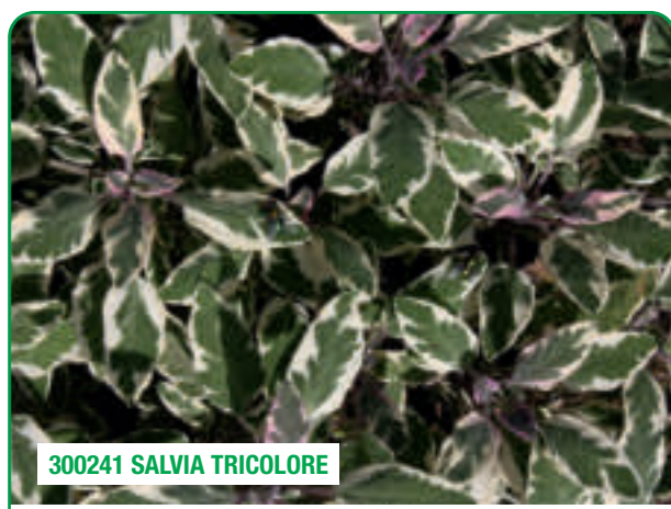
300241 SALVIA TRICOLORE

Facile da coltivare, adatta per combinazioni Easy to grow, suitable for combinations Ușor de cultivat, potrivită pentru combinații de plante și/sau culori