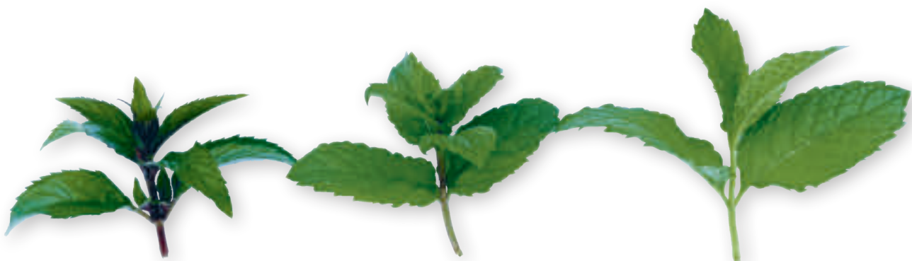
300311 MENTA PIPERITA