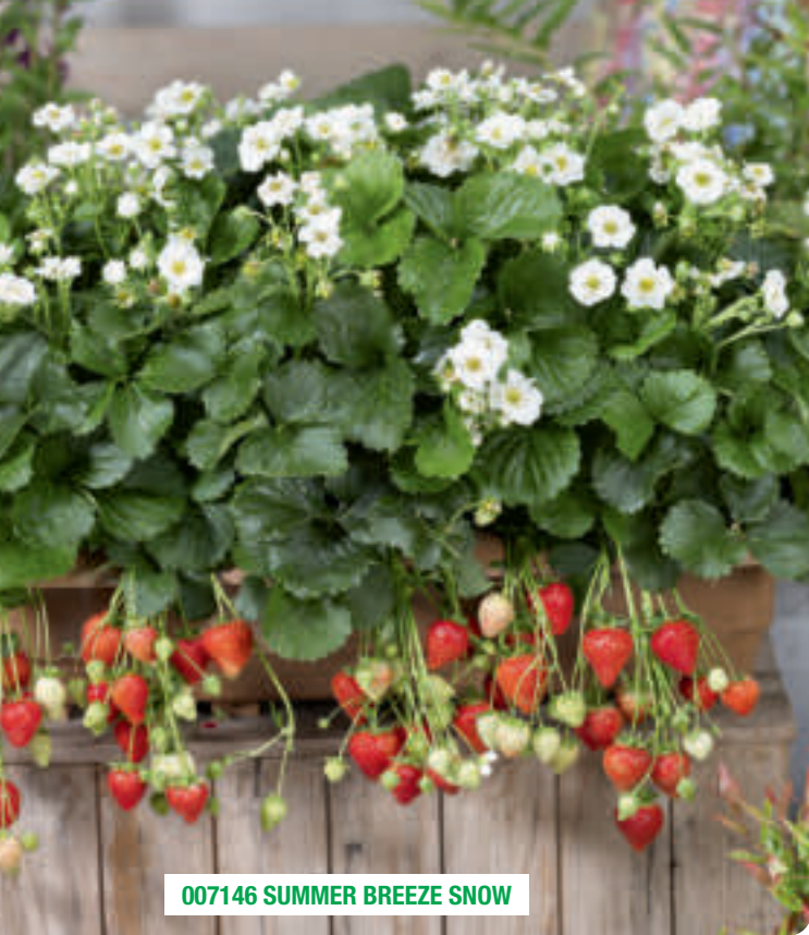
007146 SUMMER BREEZE SNOW