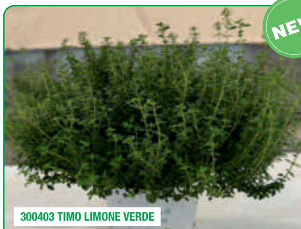
300403 TIMO LIMONE VERDE

Forte aroma di limone, chioma variegata con colori stabili Strong lemon scent, variegated ground-covering foliage in stable colours Frunze cu miros puternic de lamâie, Foliaj acoperitor de sol, culori stabile ale frunzelor