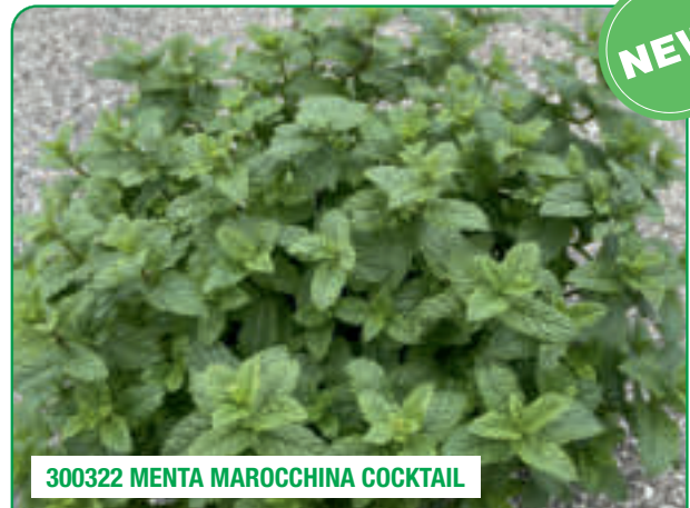
300322 MENTA MAROCCHINA COCKTAIL

Crescita robusta senza stoloni, ideale per Mojito Robust growth with no runners, ideal for preparing Mojito cocktails Creștere robustă, fără stoloni, ideală pentru Mojito