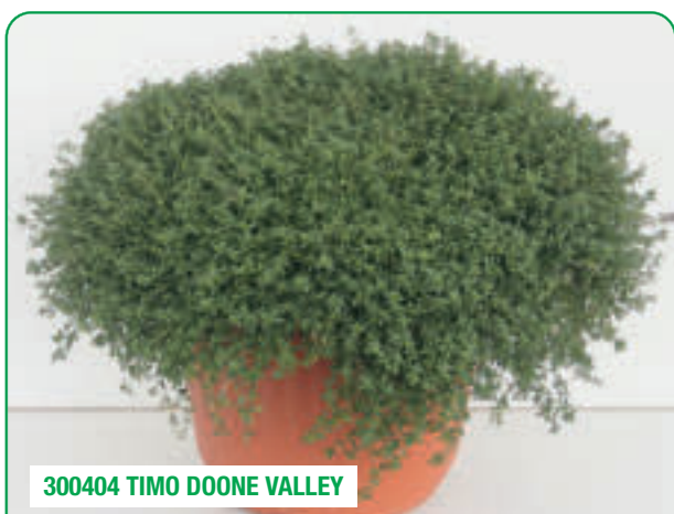
300404 TIMO DOONE VALLEY

Foglia verde con intenso aroma di limone Tiny green leaves with an intense lemony aroma Frunze verzi de dimensiuni reduse, cu aromă intensă de lamâie