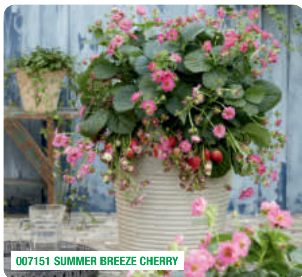
007151 SUMMER BREEZE CHERRY

Flori duble dar si semi-duble, de diferite culori Fructe dulci, formă conică (±18 g)