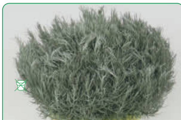
301001 ELICRISO ITALICO (LIQUIRIZIA)

Selezione molto resistente, con aroma di anice Extremely resistant selection, with an aniseed scent Tarhon, selecție extrem de rezistentă, aromă de anason