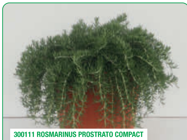
300111 ROSMARINUS PROSTRATO COMPACT

Lungamente ricadente, paesaggistico Long and trailing, landscaping Comportament curgător, potrivit pentru peisagistică