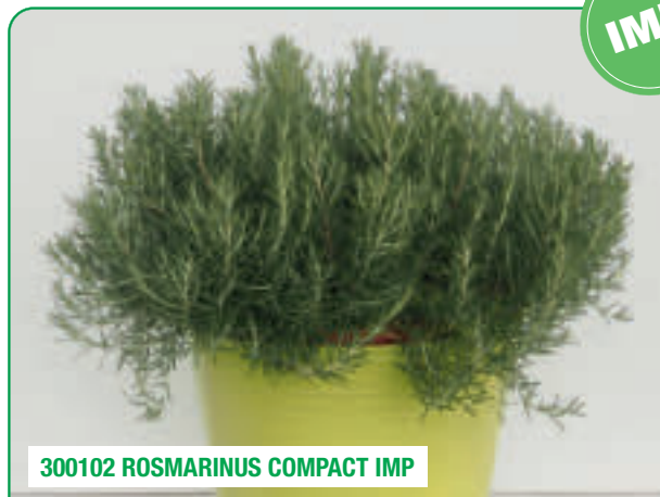
300102 ROSMARINUS COMPACT IMP

Eretto e robusto, aroma intenso Strong and erect, with an intense aroma Plantă puternică și erectă, cu aromă intensă