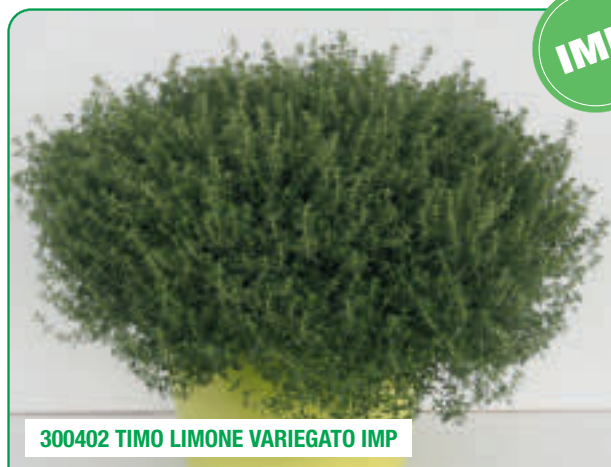
300402 TIMO LIMONE VARIEGATO IMP

Foglie decorative al profumo di agrumi Decorative citrus-scented leaves Fruze decorative cu miros de citrice