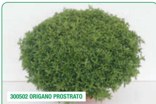
300502 ORIGANO PROSTRATO

Semi-eretto, aroma intenso Semi-erect, with an intense aroma Comportament semi-erect, cu aromă intensă