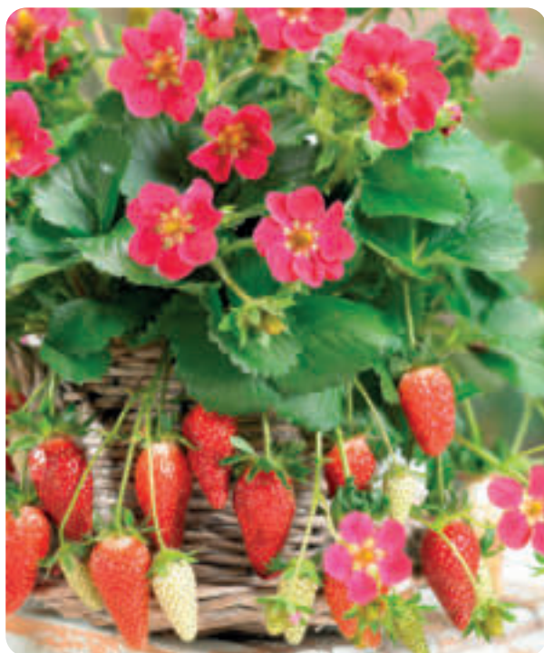
007127 PERNILLA F1 (TRISTAN)

Inflouescență continuă, fără stoloni. Recomandate pentru cultura în ghivece