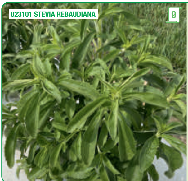
023101 STEVIA REBAUDIANA