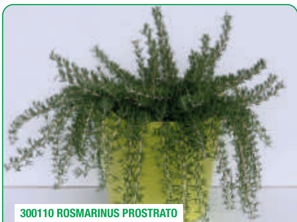
300110 ROSMARINUS PROSTRATO

Compatto, ideale per vaso Compact, ideal for pots Compact, ideal pentru ghivece