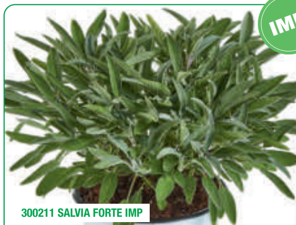
300211 SALVIA FORTE IMP

Crescita vigorosa, foglie enormi Vigorous growth, enormous leaves Creștere viguroasă, frunze imense