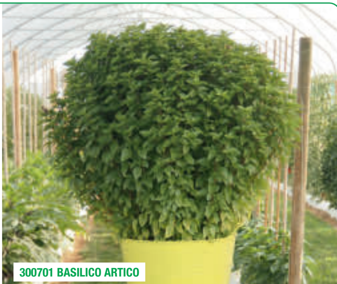
300701 BASILICO ARTICO

Tolerant la temperaturi scăzute Creștere robustă și columnară Rezistent la botritis