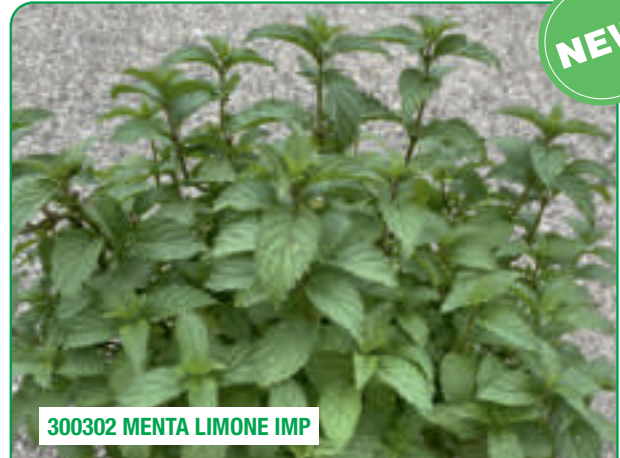
300302 MENTA LIMONE IMP

Forte aroma di menta, gambo scuro Strong mint scent, dark stem Parfum intens mentolat, tijele de culoare închisă