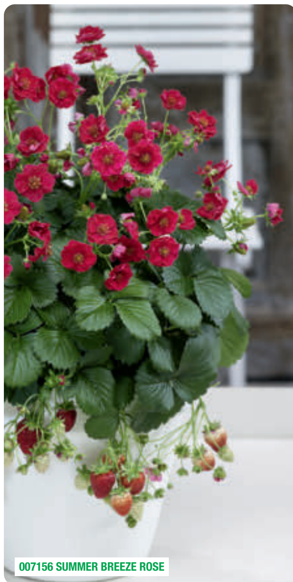
007156 SUMMER BREEZE ROSE