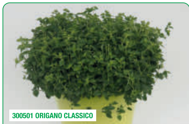
300501 ORIGANO CLASSICO

Semi-eretto, aroma intenso Semi-erect, with an intense aroma Comportament semi-erect, cu aromă intensă