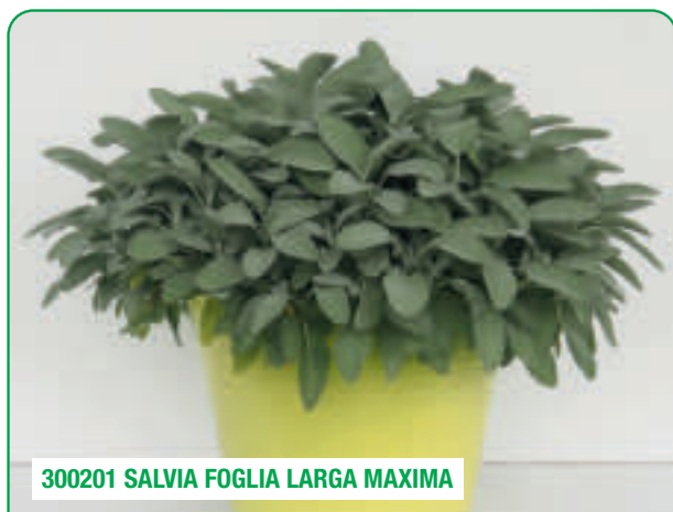
300201 SALVIA FOGLIA LARGA MAXIMA

Crescita vigorosa, foglie enormi Vigorous growth, enormous leaves Creștere viguroasă, frunze imense