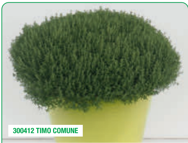
300412 TIMO COMUNE

Chioma eretta e densa, foglie strette Dense, upright foliage, narrow leaves Foarte dens, creștere erectă, frunze abundente