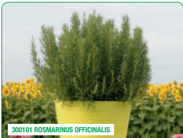
300101 ROSMARINUS OFFICINALIS

Eretto e robusto, aroma intenso Strong and erect, with an intense aroma Plantă puternică și erectă, cu aromă intensă