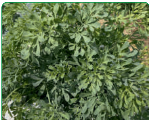
050901 RUTA Rue / Weinraute