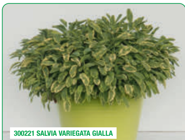
300221 SALVIA VARIEGATA GIALLA

Foglia stretta, tollerante all'oidio Narrow leaf, mildew tolerant Flori alungite, rezistentă la botritis