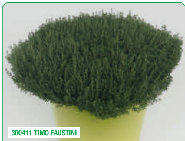
300411 TIMO FAUSTINI

Crescita compatta e tappezzante, decorativo a basse temperature Compact growing and ground covering, decorative, better colours at low temperatures Creștere compactă, acoperitor de sol, decorativ, culori frumoase la temperaturi scăzute