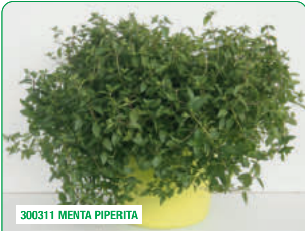
300311 MENTA PIPERITA

Forte aroma di menta, gambo scuro Strong mint scent, dark stem Parfum intens mentolat, tijele de culoare închisă