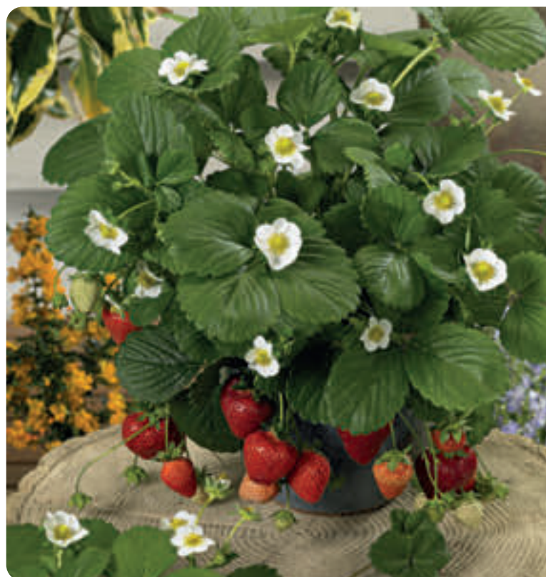
007124 ORIANA F1 (LORAN)