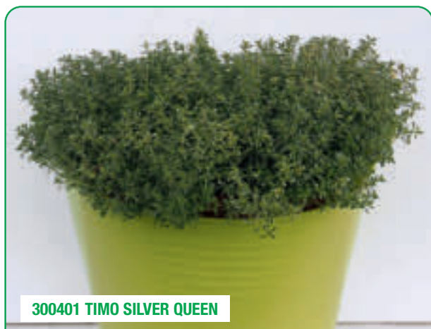
300401 TIMO SILVER QUEEN

Foglie decorative al profumo di agrumi Decorative citrus-scented leaves Fruze decorative cu miros de citrice