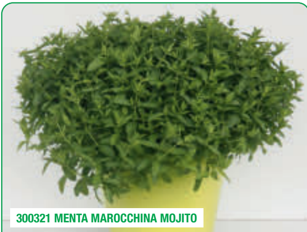
300321 MENTA MAROCCHINA MOJITO

Crescita robusta senza stoloni, ideale per Mojito Robust growth with no runners, ideal for preparing Mojito cocktails Creștere robustă, fără stoloni, ideală pentru Mojito