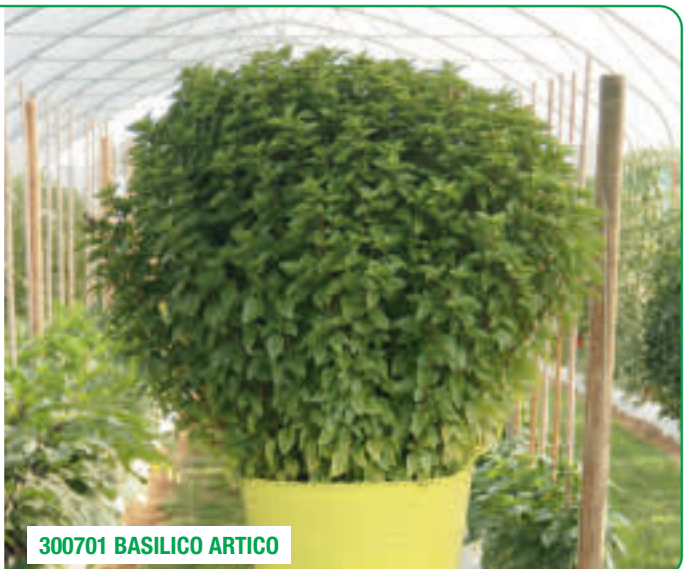
300701 BASILICO ARTICO

Tolera temperaturas más bajas Crecimiento robusto y en columna Tolerante al mildiú de la albahaca