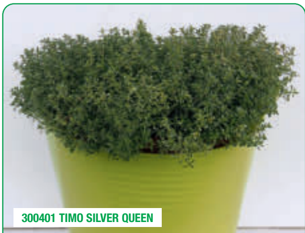
300401 TIMO SILVER QUEEN

Foglie decorative al profumo di agrumi Feuilles décoratives au parfum d'agrumes Hojas decorativas con aromas cítricos