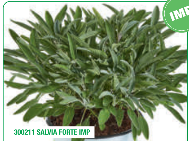
300211 SALVIA FORTE IMP

Crescita vigorosa, foglie enormi Croissance vigoureuse, feuilles immenses Crecimiento vigoroso, hojas de gran tamaño