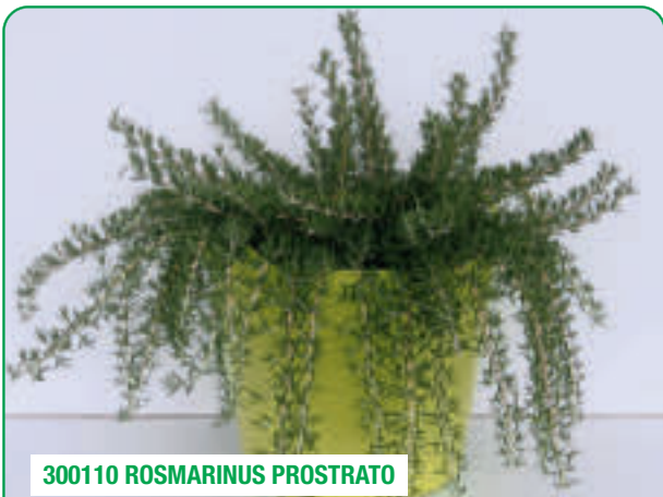
300110 ROSMARINUS PROSTRATO

Compatto, ideale per vaso Compact, idéal en pots Planta compacta, ideal para macetas