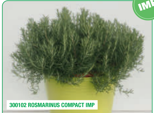
300102 ROSMARINUS COMPACT IMP

Eretto e robusto, aroma intenso Robuste et érigé, avec un arôme intense Fuerte y de porte erecto, con un aroma intenso