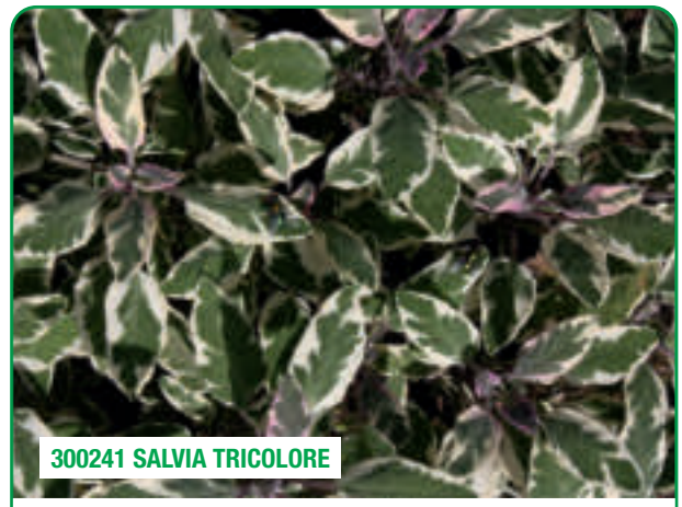
300241 SALVIA TRICOLORE

Facile da coltivare, adatta per combinazioni Facile à cultiver, adaptée pour les associations Fácil de cultivar, indicada para combinaciones