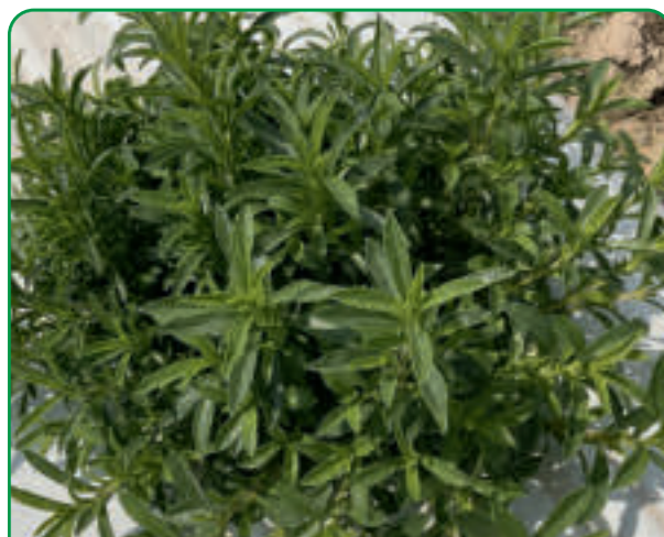
051201 SANTOREGGIA (SATUREJA MONTANA) Sarriette / Ajedrea