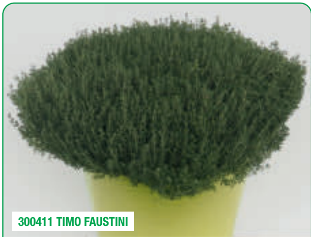
300411 TIMO FAUSTINI

Crescita compatta e tappezzante, decorativo a basse temperature Compacte et couvre-sol, très décorative, couleurs plus belles à basse température Compacto y tupido, muy decorativa, colores más bonitos con temperaturas bajas