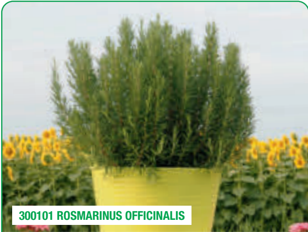
300101 ROSMARINUS OFFICINALIS

Eretto e robusto, aroma intenso Robuste et érigé, avec un arôme intense Fuerte y de porte erecto, con un aroma intenso