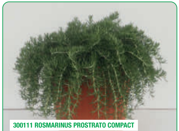
300111 ROSMARINUS PROSTRATO COMPACT

Lungamente ricadente, paesaggistico Long et retombant, paysagé Variedad larga y colgante, paisajista