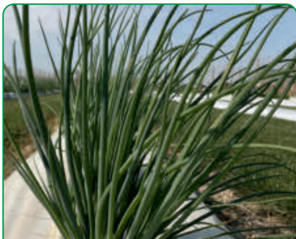
050401 ERBA CIPOLLINA Ciboulette / Cebollana