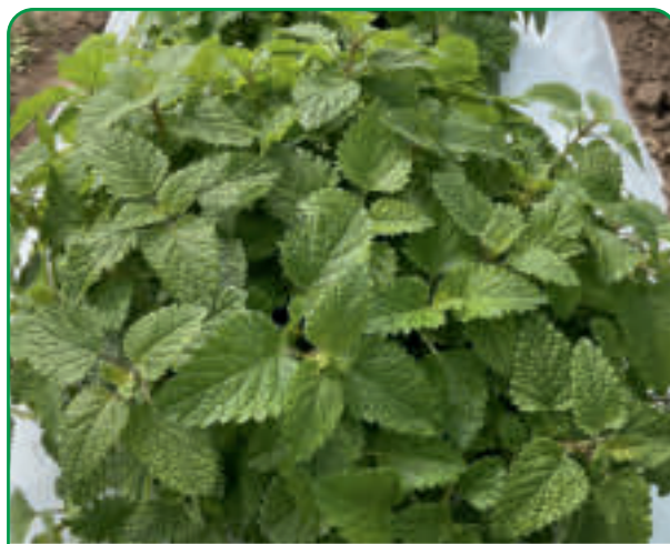
050701 MELISSA Melisse Citronelle / Melisa