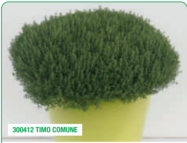
300412 TIMO COMUNE

Chioma eretta e densa, foglie strette Dense, feuillage érigé, feuilles étroites Porte erecto, follaje denso, hojas estrechas